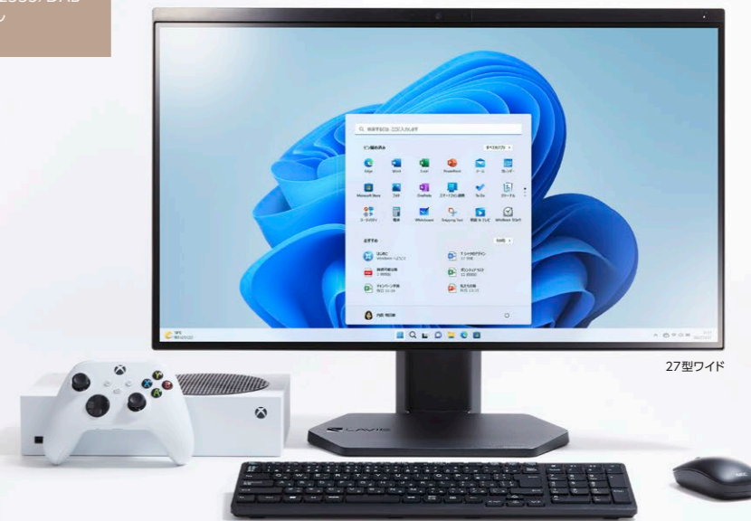
※画像はイメージです。本体以外は付属しません。