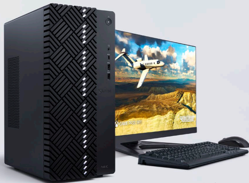
※ディスプレイは別売です。